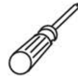
Phillips Screwdriver Destornillador Phillips

Tools and Supplies Required Se requieren herramientas y suministros