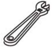
Adjustable Wrench Llave ajustable