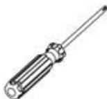
Phillips Screwdriver Destornillador Phillips